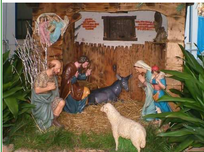
Il presepe nel cortile del nostro oratorio

ore 17 in chiesa parrocchiale 16 - 24 dicembre