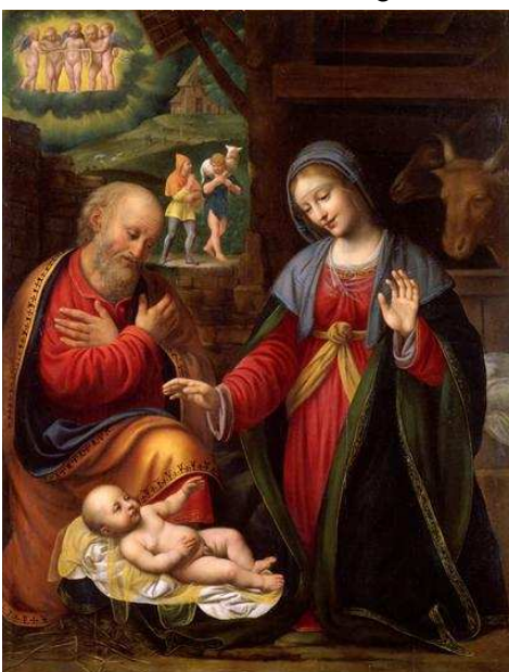
Natività di Bernardino Luini

Anche la “novena del Natale” possa diventare un cammino più personalizzato incontro al Signore. “Il